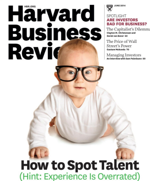
HARVARD BUSINESS REVIEW - HOW TO STOP TALENT?