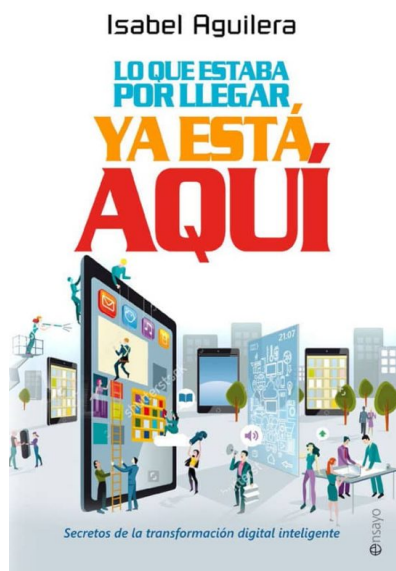
LO QUE ESTABA POR LLEGAR YA ESTÁ AQUÍ